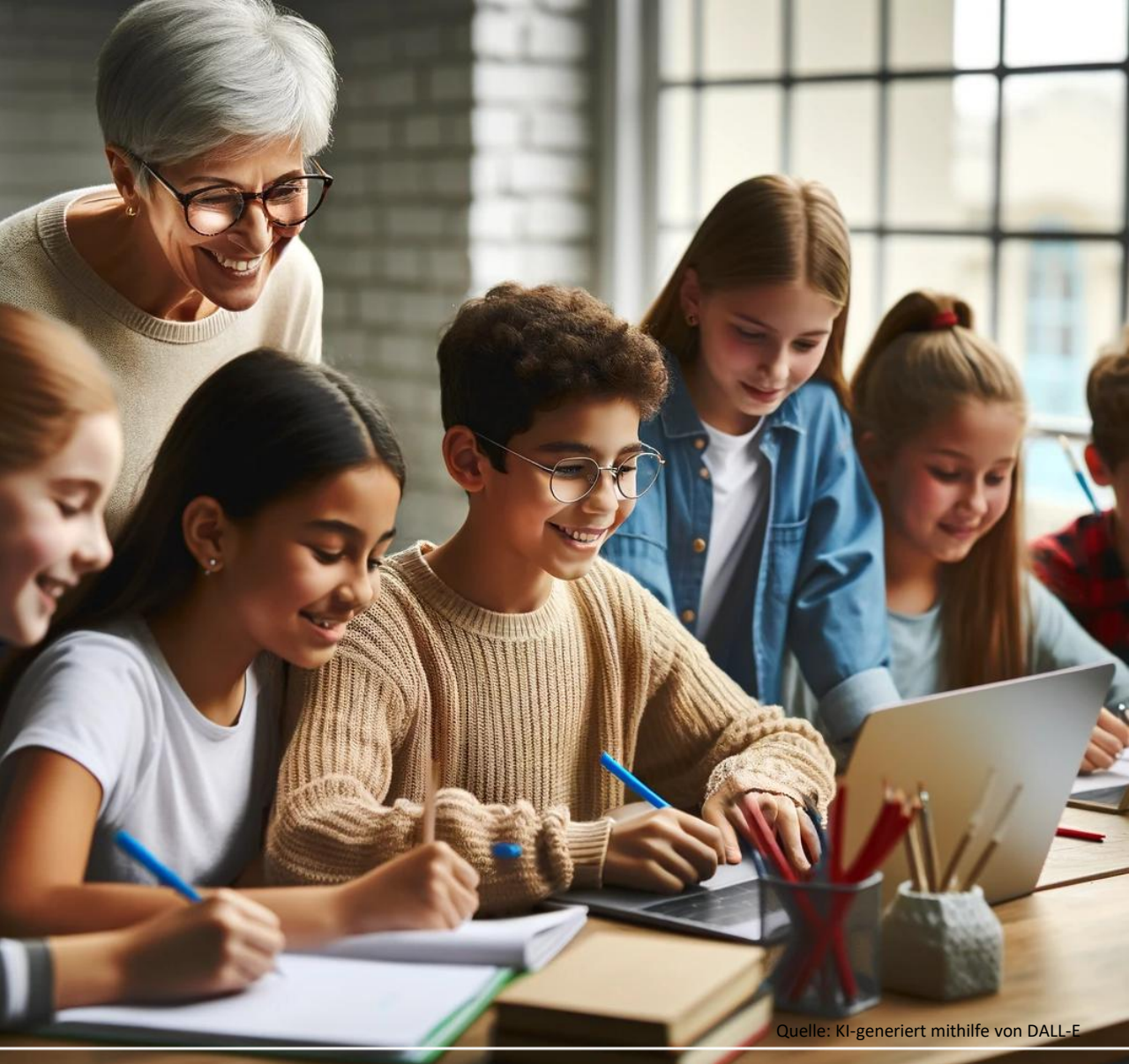
Quelle: KI-generiert mithilfe von DALL-E